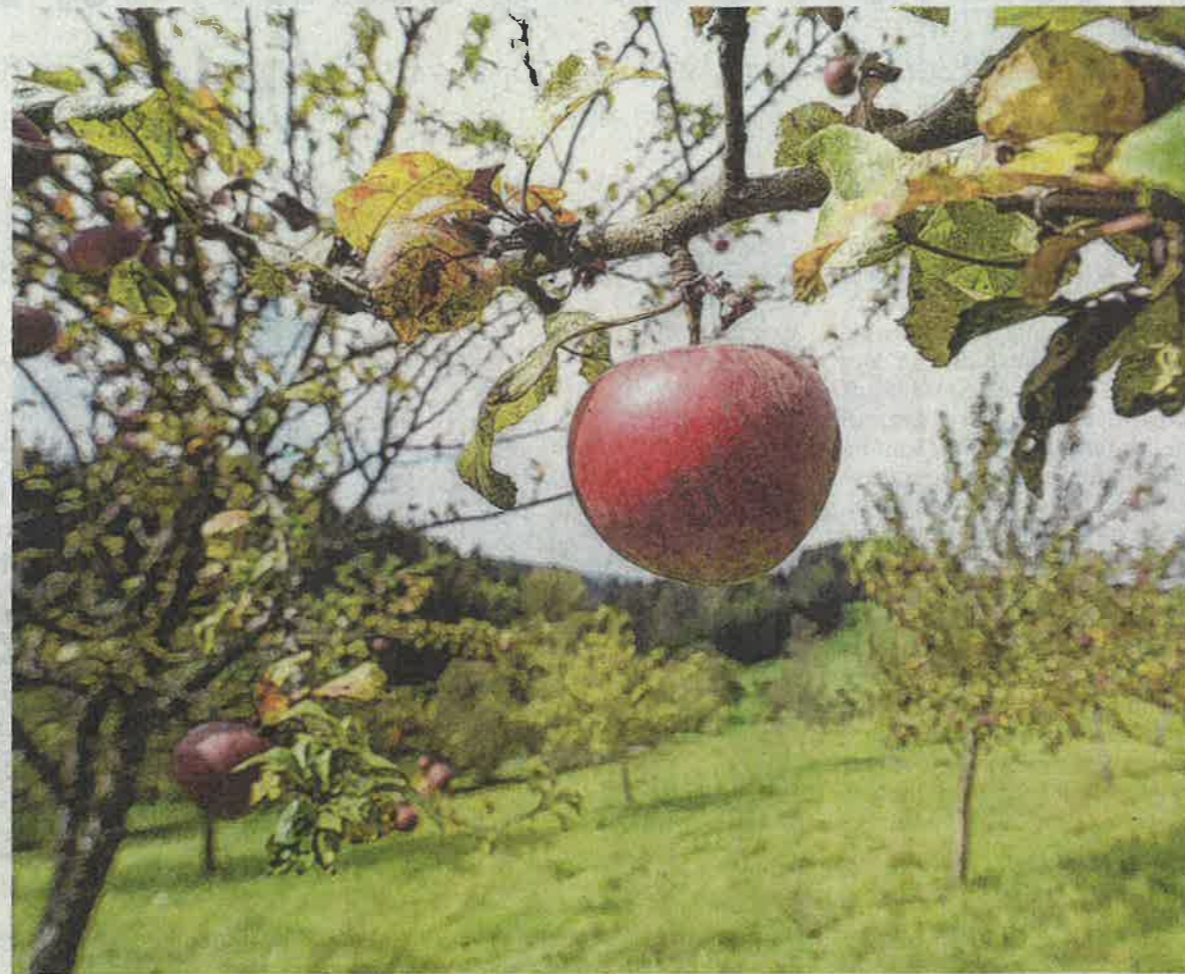
Der Obst- und Gartenbauverein Gammelshausen bleibt der Obstbaugemeinde erhalten. (Symbolbild)

Ämter zu besetzen, fiel dem Verein zunehmend schwer. „Wir waren sehr in Sorge um unseren