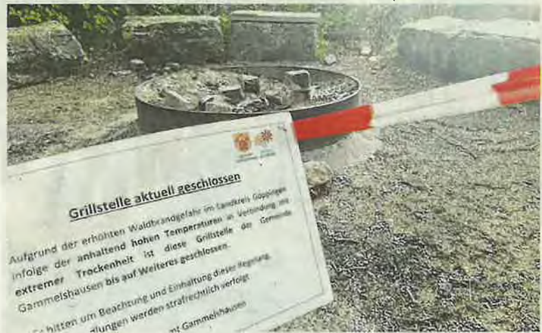
Ein typisches Bild in diesen Tagen: Grillstelle gesperrt.