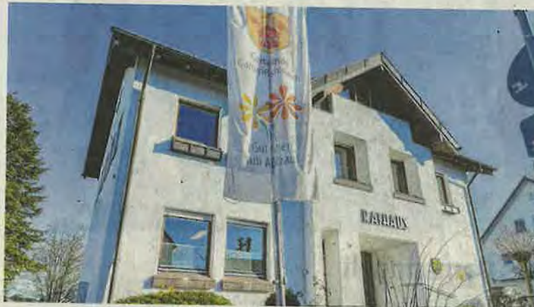
Neubaupläne sind vom Tisch: Das Rathaus in Gammelshäuser bleibt erhalten und bekommt eine neue Heizung.

Gammelshäuser. Der Gammelshäuser Gemeinderat beschloss einstimmig den Einbau einer Wärmepumpe für das Rathaus, die rund 60 000 Euro kosten wird. Der Eigenanteil der Gemeinde liegt bei 42 000 Euro, vom Bund kommt ein Zuschuss. Gemeinderat Bernhard Mürter wunderte sich über den Preis. Seine Wärmepumpe sei wesentlich günstiger gewesen und er möchte die Angebote gerne einsehen, um einen Vergleich zu haben. Heike Mohring war wichtig, dass der Bevölkerung vermittelt werde, dass es keine Pläne für ein neues Rathaus gebe und das Rathaus er-