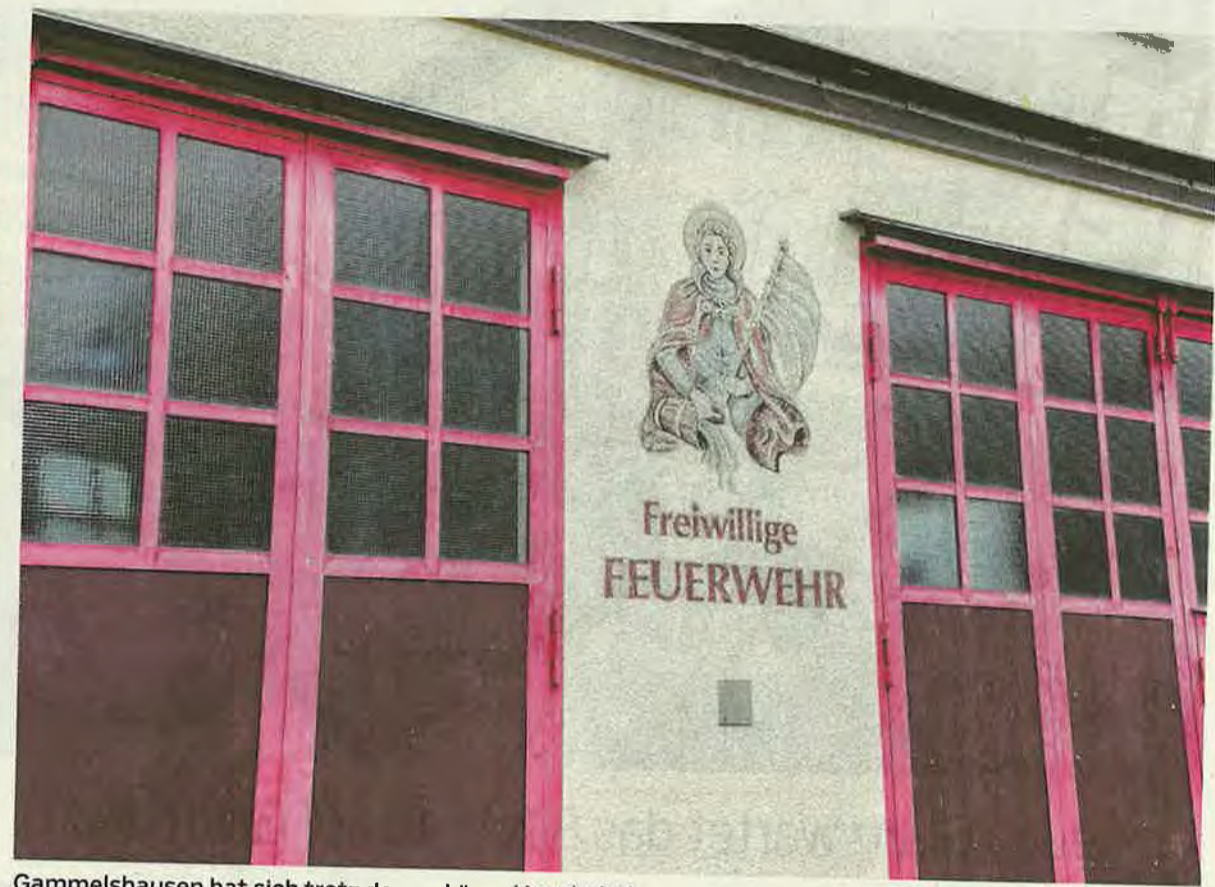
Gammelshausen hat sich trotz der prekären Haushaltslage einiges vorgenommen. Für die Erweiterung des Feuerwehrmagazins wurde ein Schlüssel-Grundstück erworben.