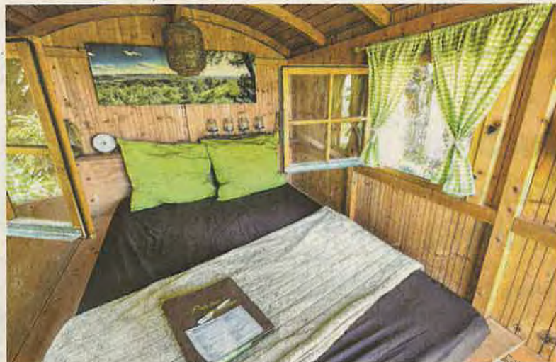
Er findet seine Liebhaber: Der Schäferwagen des Tourismusverbands Schwäbischer Albtrauf.