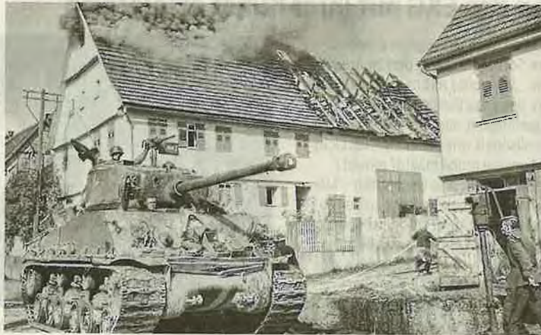
Ein Bild aus Roßwälden beim Einmarsch der Amerikaner.