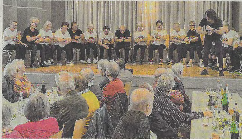
Senioren in Bewegung: Die Sport- und Gymnastikgruppe animierte die Gäste zum Mitmachen.