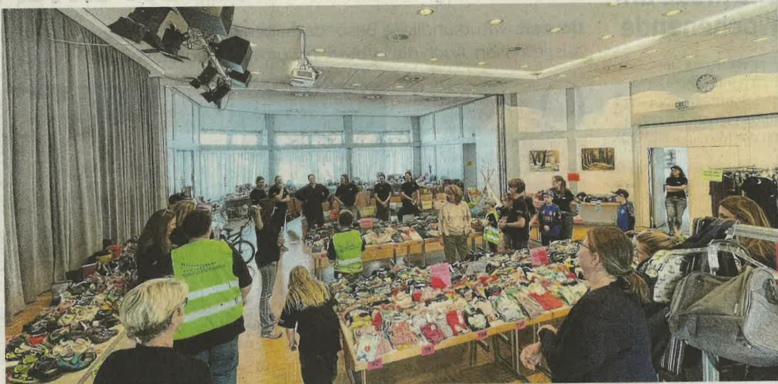
Eine große Verkaufsfläche: 6000 Artikel bietet der Kindersecondhand-Basar im Gammelshäuser Gemeindehaus.