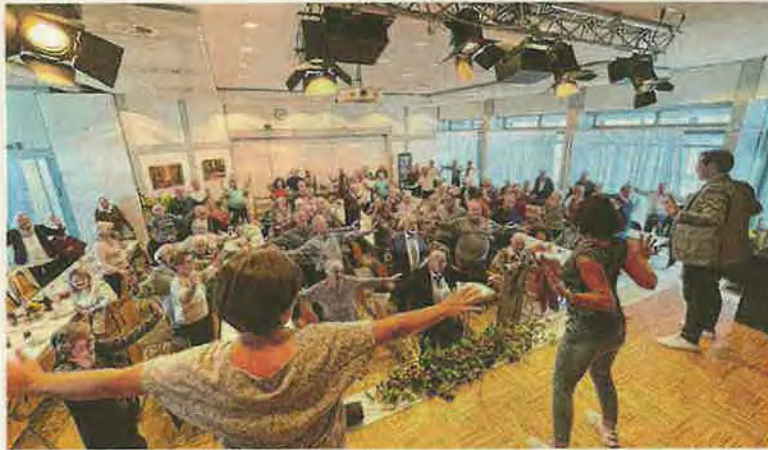
Beweglich bleiben heißt das Motto beim Sport für Senioren der Volkshochschule.