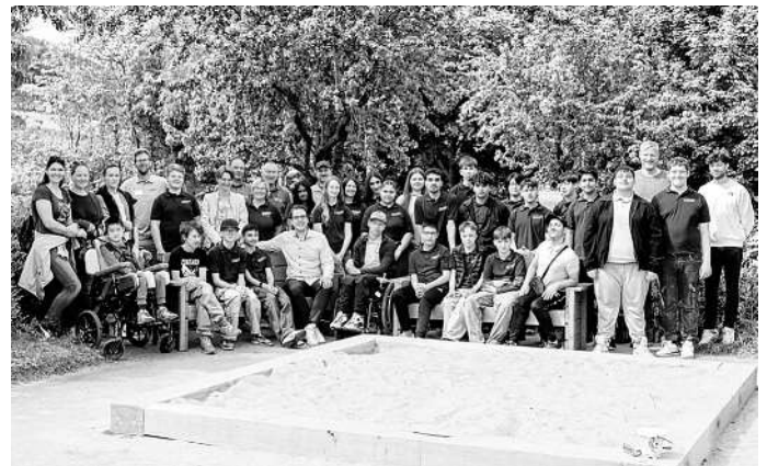
... die sich alle für ein Gruppenfoto versammelten