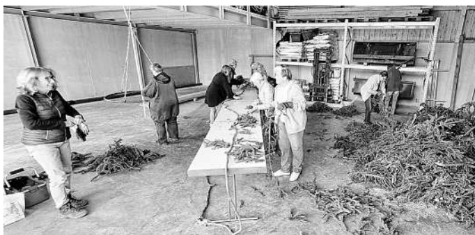
Die Landfrauen in Aktion: Hier werden Girlande und Kranz für den Maibaum produziert