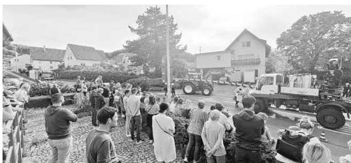
Unter einer großen Zuschauerschar wird der Maibaum aufgerichtet