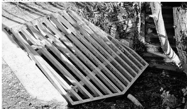
Ein erster Rechen sitzt nun im Heubach hinter dem Bauhofgebäude

Hinter dem Bauhof der Gemeinde wurde in diesen Tagen im Heubach ein Rechen eingebaut und damit eine weitere wichtige Maßnahme im Hochwasserschutz für die Gemeinde umgesetzt. Nach der vom Landratsamt Göppingen erteilten wasserrechtlichen Erlaubnis wurde in Zusammenarbeit zwischen dem Gammelshäuser Bauhofteam (Betonfundament) und der Fa. Maier aus Dürnau (Bau und Setzen des Rechens) der erste von insgesamt zwei geplanten Rechen realisiert, die Treibgut abfangen und vor Überlauf des Baches schützen sollen. Der zweite Gewässerrechen wird in den nächsten Wochen, etwa 30 Meter vorgelagert zur Umsetzung kommen. Seit dem jüngsten Starkregen- und Hochwasserereignis im Juni 2024 sind Verwaltung und Gemeinderat intensiv daran, Lösungen für die Gemeinde zu erarbeiten. Neben dem Starkregenerisikomanagement , das die Gemeinde Gammelshausen federführend mit den Gemeinden Heiningen, Eschenbach und Schlät interkommunal erarbeitet sind in einem ersten Schritt jene Gewässerrechen sowie bauliche Veränderungen im Bereich der Kirchstraße 14 geplant. Zudem hat die Gemeinde Anfang der Woche mobile Hochwasserschutz Elemente im Wert von über 13.000 € beschafft, die ein kontrolliertes Abfließen von Oberflächenwasser ermöglichen soll. Mit diesen Elementen wird die Freiwillige Feuerwehr Gammelshausen regelmäßig üben und für einen erneut eintretenden Ernstfall Hochwasserereignisse simulieren.