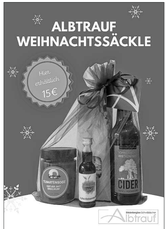
Ein ganz besonderes „G’schenke“: Das „Weihnachts-Säckle“ der Erlebnisregion Schwäbischer Albtrauf