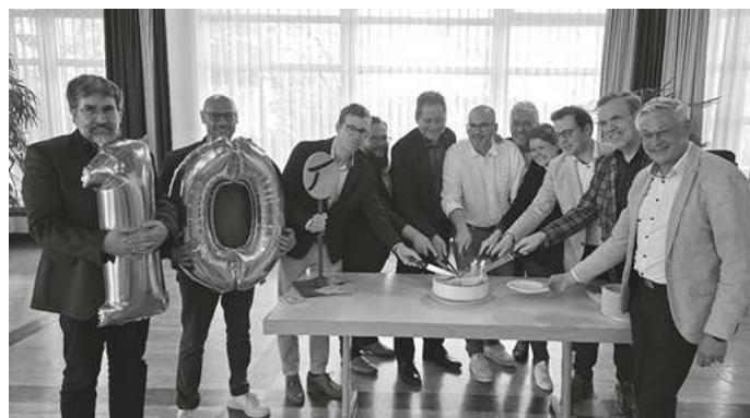
Albtraufgänger-Bürgermeisterinnen und Bürgermeister beim Tortenanschnitt bei der jüngsten Mitgliederversammlung in Donzdorf

Zum 10-jährigen Jubiläum ist ein gemeinsamer Rückblick mit Wanderfreunden, Wegbegleitern und Verantwortlichen geplant. Der Albtraufgänger ist mehr als nur ein Wanderweg – er ist ein Symbol für nachhaltigen Tourismus, regionale Zusammenarbeit und die Schönheit des Albtraufs.