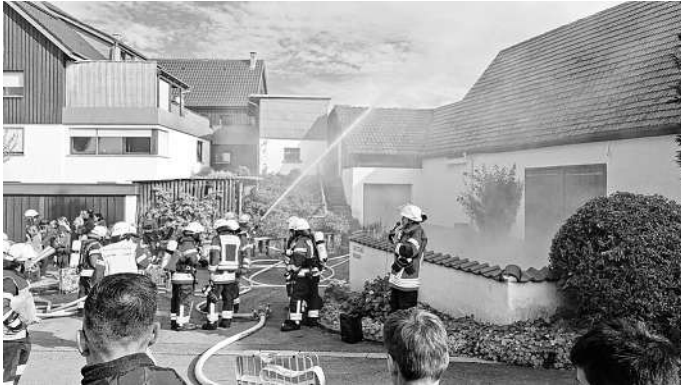
In Aktion: Die Freiwillige Feuerwehr Gammelshausen bei der diesjährigen Hauptübung