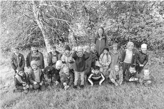
Klasse 1b beim Äpfel sammeln

Am zweiten Tag wurden die gesammelten Äpfel fleißig in kleine Stücke geschnitten und daraus Apfelsaft und Apfelmus hergestellt. Unser selbst gepresster Apfelsaft wurde als „der Beste“ von uns eingestuft. Zwischendurch probierten wir auch verschiedene Apfelsorten , wobei sich nach einem Ranking herausstellte, dass der Boskoop der Lieblingsapfel der Klasse 1b ist. Zum Abschluss wurde gemeinsam mit den Eltern das Apfelmus mit frisch gebackenen Waffeln verköstigt.