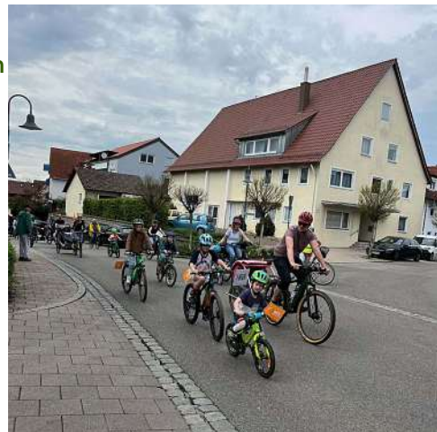
Kidical Mass 2023 in Bad Boll

Wir fordern ein kinderfreundliches Straßenverkehrsrecht, denn das ist Voraussetzung für sichere und selbständige Mobilität (nicht nur) der Kinder. Wir wollen, dass sich alle Kinder und Jugendlichen sicher und selbständig mit dem Fahrrad bewegen können. Dafür braucht es sichere Fahrradwege, ein durchgehendes Radwegenetz und Tempo 30 als Regelgeschwindigkeit.