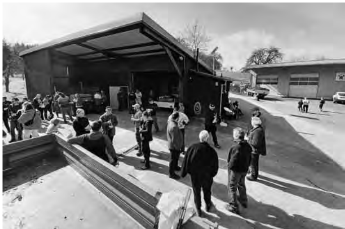
Zahlreiche Bürger*innen zeigten ihr ehrenamtliches Engagement bei der diesjährigen „Ortsputzete“ in Gammelshausen